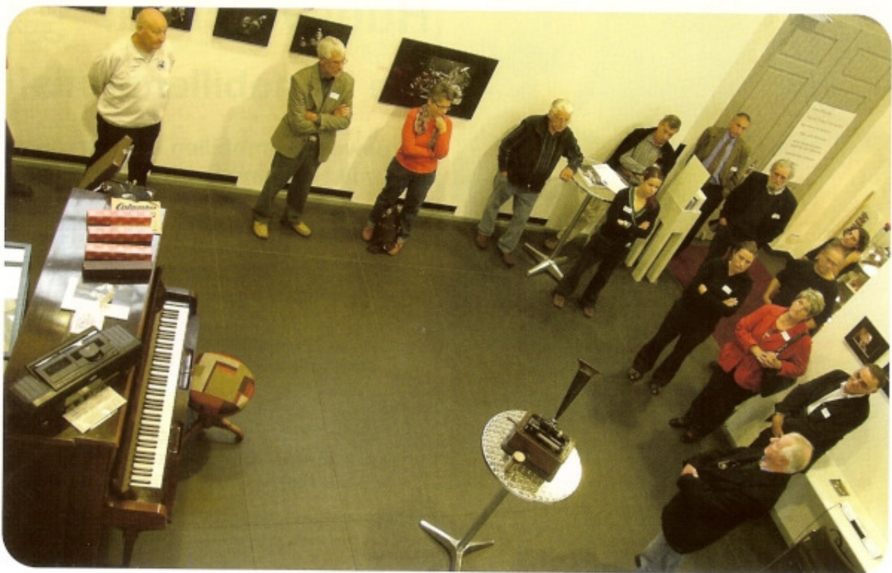
Aufmerksame Zuhörer während eines Rundgangs im SwissJazzOrama.