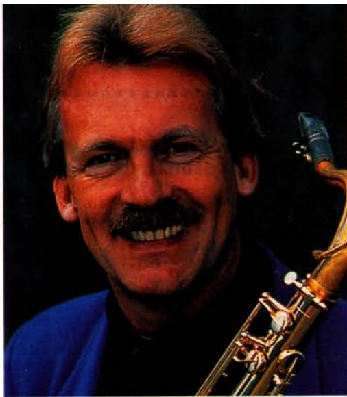
Bandleader, Saxophonist und Flötist Pepe Lienhard.