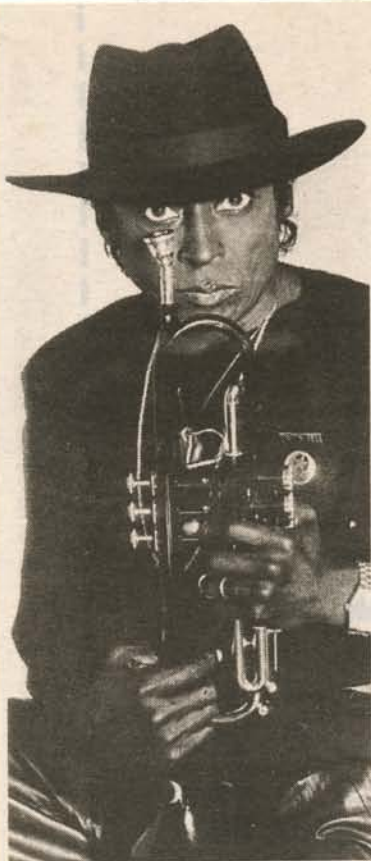
Zum fünften Mal dabei: die Jazz-Koryphäe Miles Davis.

Herbie Hancock kbd, Michael Brecker sax, Al Foster d, Buster Williams b. 7.7. Montreux