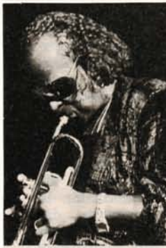
Regelmäßiger Gast am Jazz-Festival Montreux: Superstar Miles Davis

Avec Miles Davis et Herbie Hancock Quartet